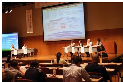
ブロック全国協働戦略会議