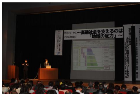
市民フォーラム・生駒