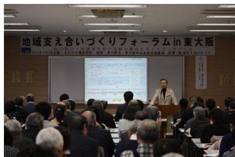
地域支え合いづくりフォーラム・東大阪