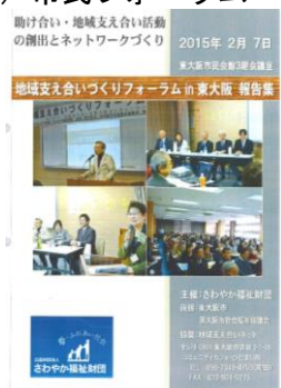
東大阪市フォーラム報告書 (表紙・裏表紙)