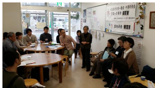
インストラクター養成・中期研修会